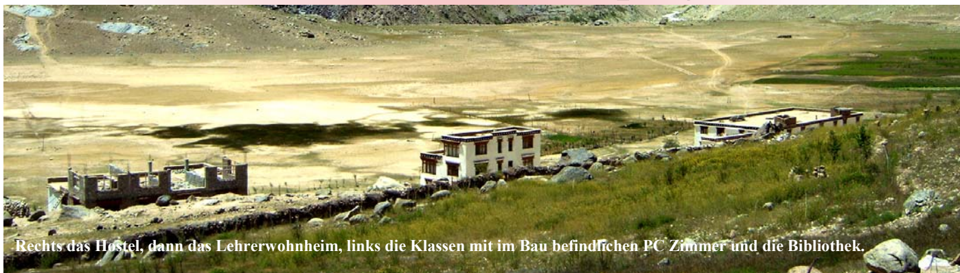
Rechts das Hostel, dann das Lehrerwohnheim, links die Klassen mit im Bau befindlichen PC Zimmer und die Bibliothek.

Die Ortschaft Ruru liegt auf dem Weg des berühmten Zaskar Trecks. Ruru, oder Reru, besteht aus 26 Häusern und liegt 23 km südlich des Verwaltungszentrums Padum am Fluss Zaskar. Im ganzen Tal von Padum bis nach Kargyak leben ungefähr 6.000 Menschen, in der Mehrzahl Bauern und Viehzüchter.