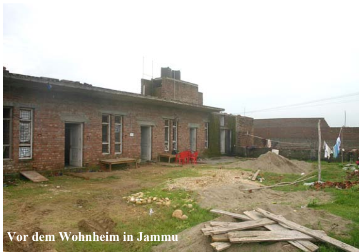
Vor dem Wohnheim in Jammu